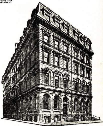
SIEGE SOCIAL 1946